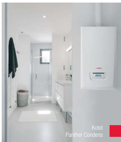
Kotol Panther Condens

výmenník tepla z odolnej hliníkovej zliatiny inšpirovaný automobilovým priemyslom, a tiež hydraulický blok novej generácie. Kotly zároveň ponúkajú takú úroveň bezpečnosti, ktorá je absolútne bezkonkurenčná.