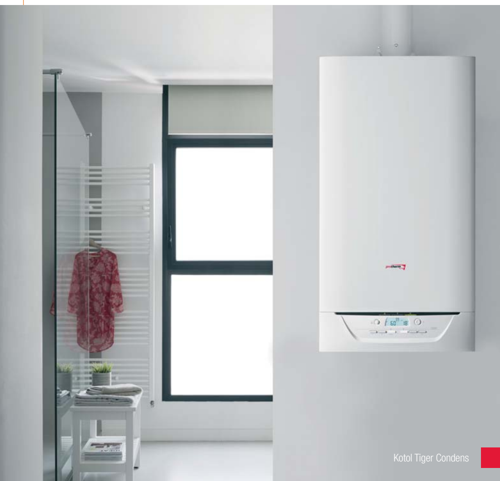
Kotol Tiger Condens

odporúčame závesné kondenzačné kotly Tiger Condens. Majú kompaktné rozmery a dokážu hravo zabezpečiť vykurovanie a dostatok teplej vody – aj pri súčasnom odbere z viacerých miest v domácnosti. Veľké množstvo teplej vody pripravujú vďaka kombinácii dodávky vody prietokovým spôsobom a zo vstavaného zásobníka. Opätovne nahriať zásobník dokážu v rekordne krátkom čase vďaka patentovanej technológii ISODYN2.