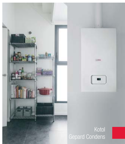
Kotol Geparď Condens