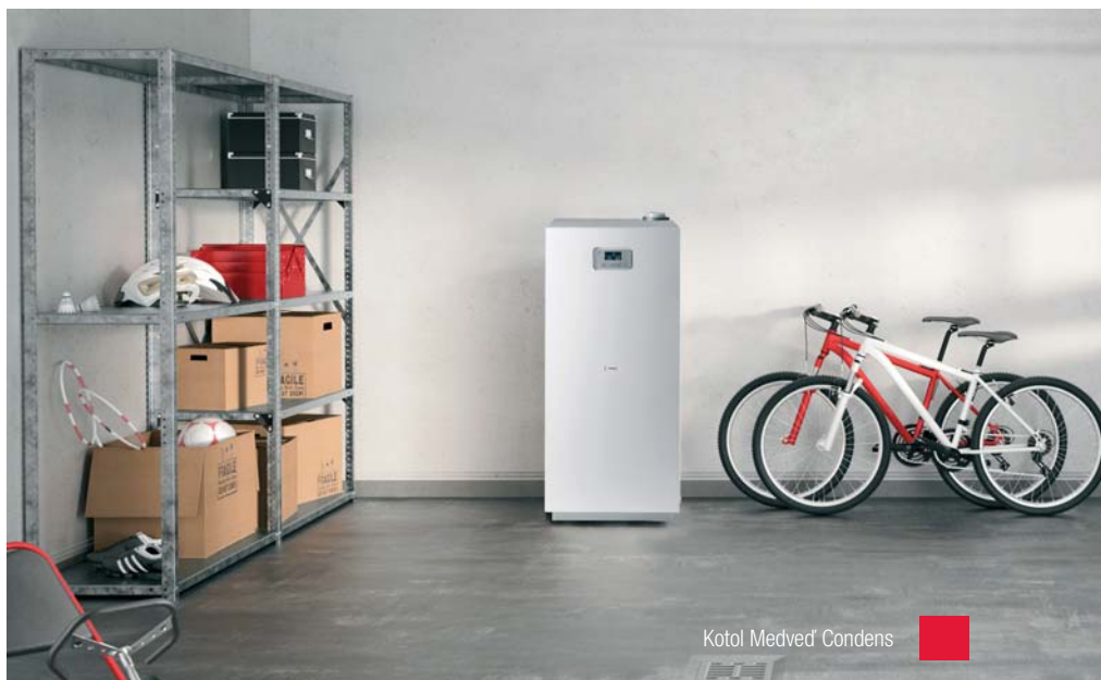
Kotol Medveď Condens

Obyvatelia rodinných domov sa v súvislosti s renováciou vykurovania často zbytočne obávajú komplikácií a dočasného diskomfortu. Dobrou správou je, že technológie pokročili a v súčasnosti je možná rýchla výmena starých kotlov za nové kondenzačné. Výnimočne jednoduchou inštaláciou vynikajú stacionárne kondenzačné kotly Medveď Condens. Svojou robustnosťou a funkčnými vlastnosťami pripomínajú liatinové kotly a zaraďujú sa do triedy energetickej účinnosti „A“. Vhodné sú pritom aj do starších rodinných domov so systémami s veľkým objemom vykurovacej vody. Ich výmenník s veľkým prierezom rúrok je veľmi odolný voči zaneseniu nečistotami.