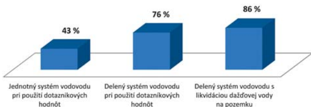
Obr. 26 Porovnanie úspor nákladov na pitnú vodu pri rôznych systémoch vodovodu

je znázornené na Obr. 25 a dosiahnuté ročné úspory pri jednotlivých systémoch sú na Obr. 26.