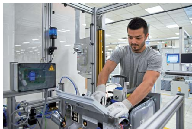
Protherm Production vďačí za svoj úspech svojim 540-tim zamestnancom.

Pod rekord pol milióna zariadení (vyrobených v roku 2017) sa podpísalo viacero faktorov. „Závod v Skalici dokázal, že má dostatočne kvalifikovaných pracovníkov, aby zvládol aj náročné