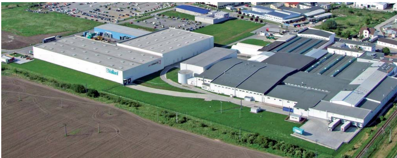
Spoločnosť Protherm Production v Skalici